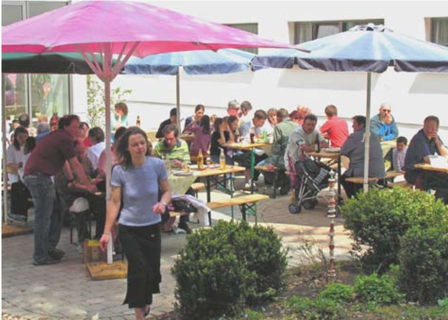
Ein schattiges Plätzchen heißt die Mittagsgäste willkommen