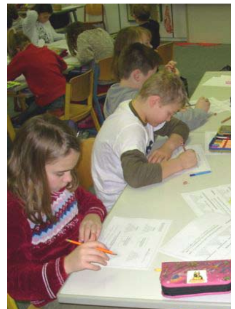
Grundschüler der Klasse 4b beim selbstständigen Arbeiten.