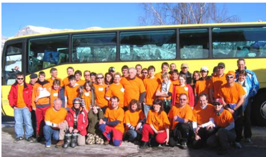
Teilnehmer der 20. Skihütte des SV Igling