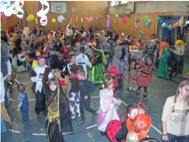
Kinderball in der Iglinger Turnhalle