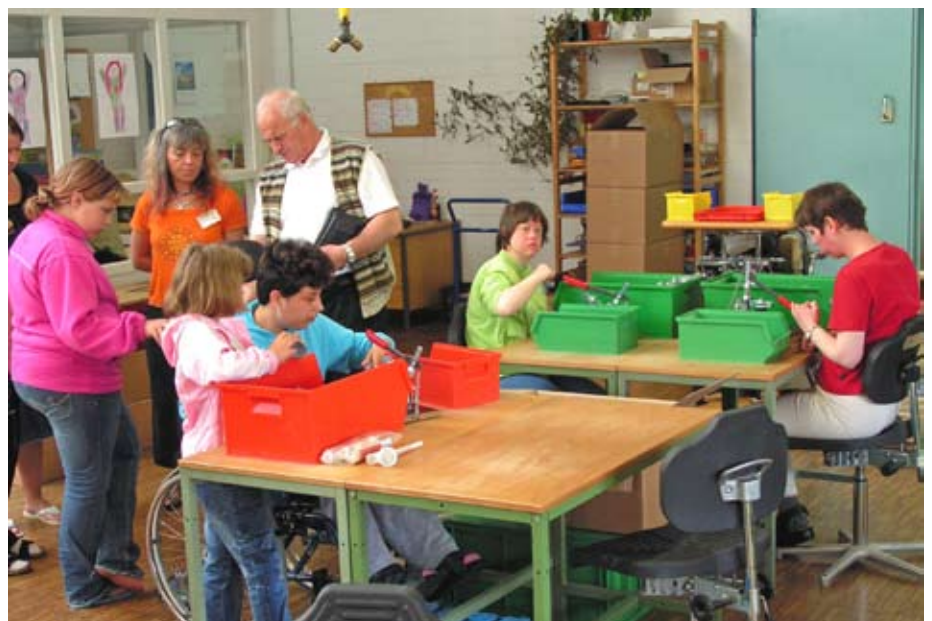
Interessant, was hier alles geleistet wird. Behinderte leben und gestalten ihr tägliches Leben.

Schließlich zeigen Förderstätte, Magnus-Werkstätten und Landwirtschaft, wie bei Regens Wagner Holzhausen gearbeitet wird.