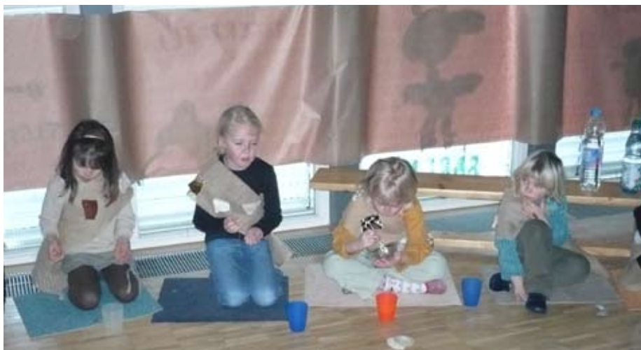
Die Feier in unserer „Steinzeithöhle“