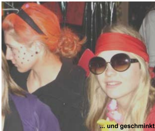
... und geschminkt