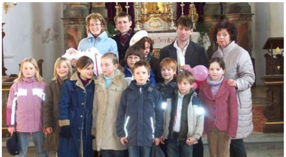
Die Unteriglinger Kommunionkinder

Wir freuen uns auf Bilder von Leuten, die das Rezept entschlüsseln und nachbacken!