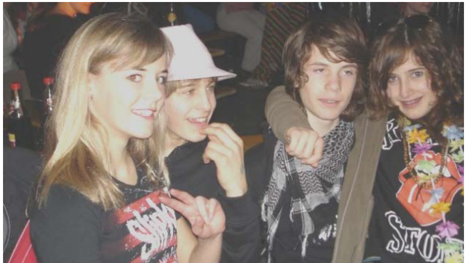
Viel zu feiern gab's für die Iglinger Jugend - ungeschminkt ...