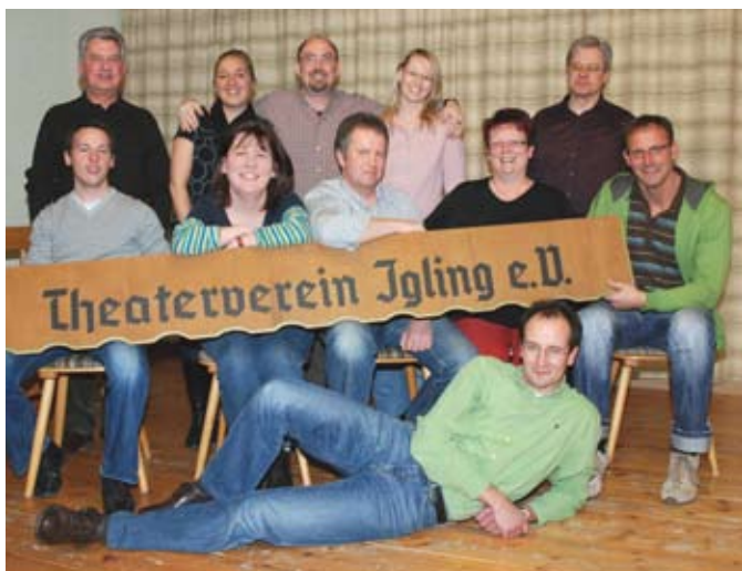
Lachende Gesichter beim Theaterverein Igling