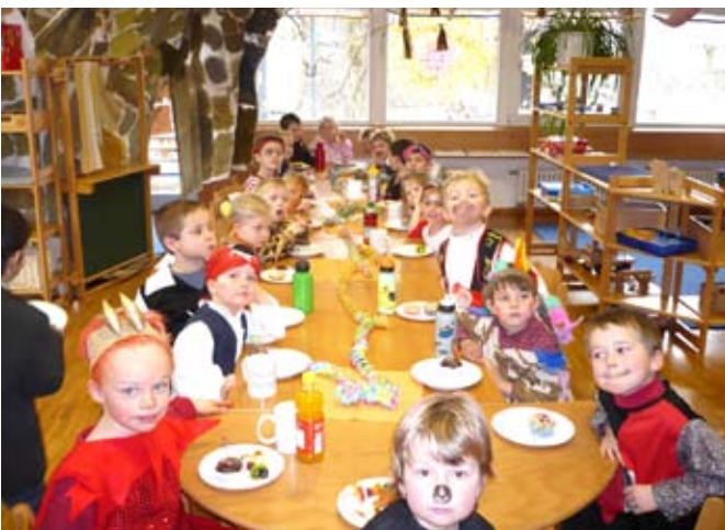
Kinderfasching im Kindergarten Igling mit dem Thema: Faschingsdinner „for all!“