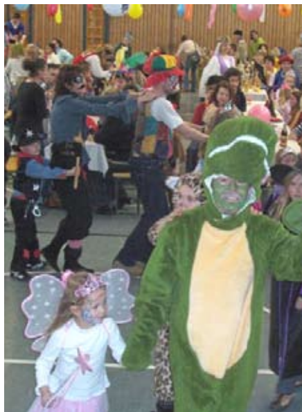
Fasching für Groß und Klein